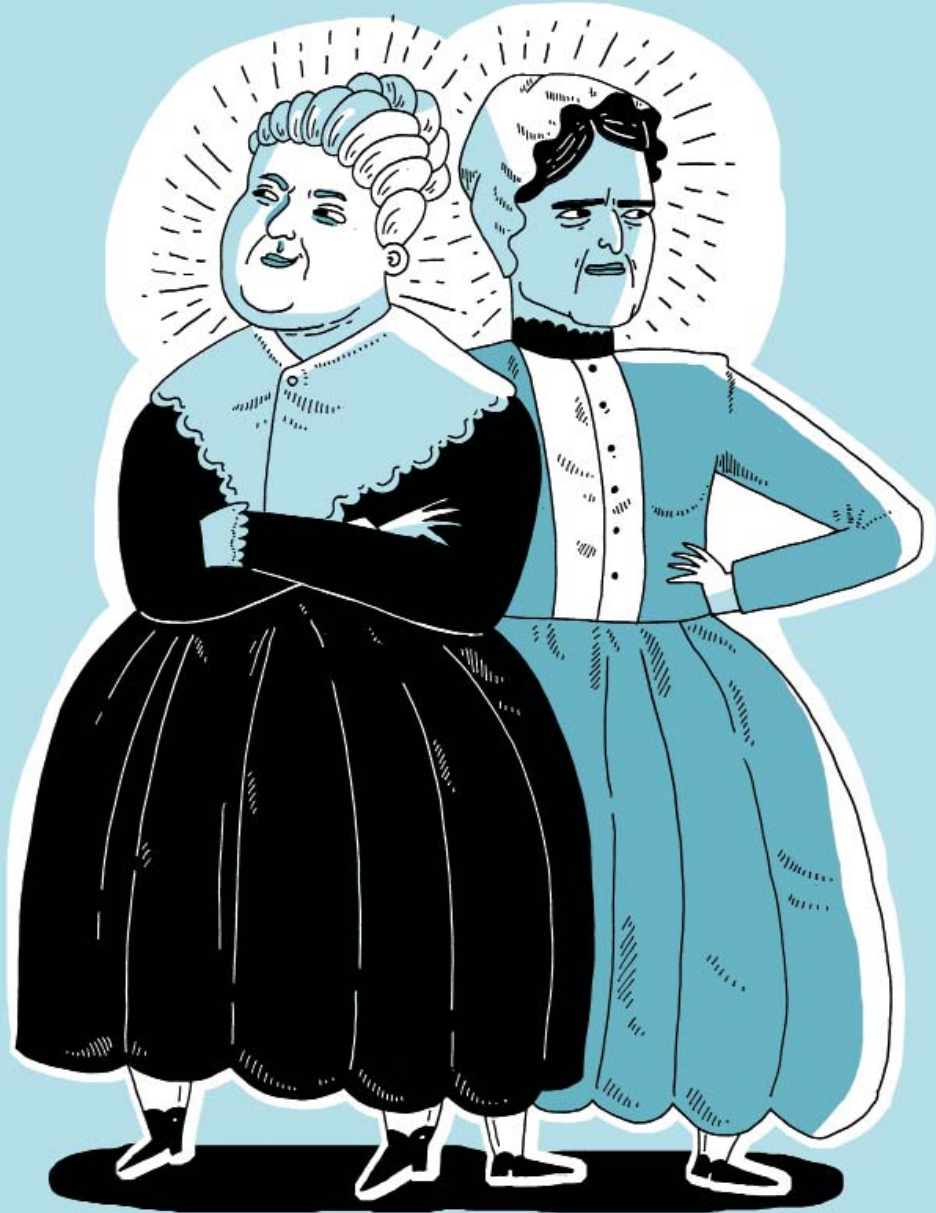
ΕΛΙΖΑΜΠΕΘ ΚΕΪΝΤΙ ΣΤΑΝΤΟΝ (1815-1902)

ΕΙΧΕ ΕΡΘΕΙ Η ΩΡΑ ΝΑ ΓΙΝΕΙ ΚΑΤΙ ΓΙΑ ΤΗ ΔΙΑΦΟΡΕΤΙΚΗ ΑΝΤΙΜΕΤΩΠΙΣΗ ΑΝΔΡΩΝ ΚΑΙ ΓΥΝΑΙΚΩΝ.